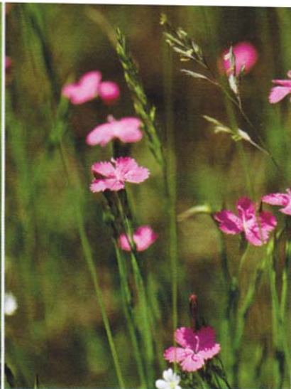
Den lilla backnejlikan trivs i full sol i torrängen.