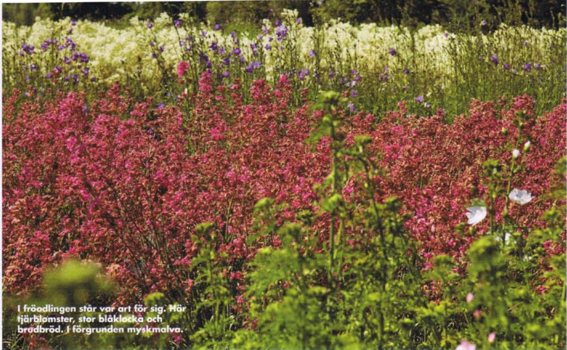
I fröodlingen står var art för sig. Här fjärblomster, stor blåklacka och brädbrod. I förgrunden myskmalva.