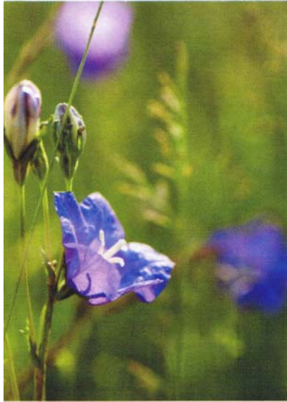
Stor blåkllocka är ett underbart inslag i en äng. Den trivs bäst i normalfuktig jord.