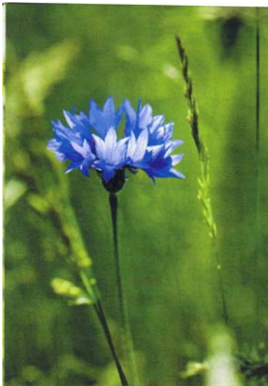
Blåklint ger fin sommarkänsla och bra blomning första året innan de andra ängsväxterna hunnit etablera sig.