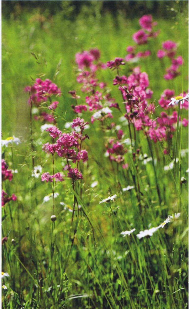
Tjärblomster trivs i torrängar tillsammans med bland annat prästkrage, liten blåkllocka och gulmåra.

rätt ursprung är viktigt för resultatet hos kunden.