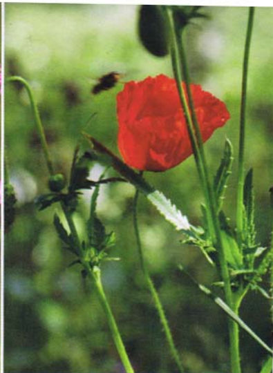
Kornvallmo är ett lysande inslag i den ettåriga blomsteråkerfröblandningen. Den trivs utmärkt i öppen jord men försvinner när ången vuxit ihop.