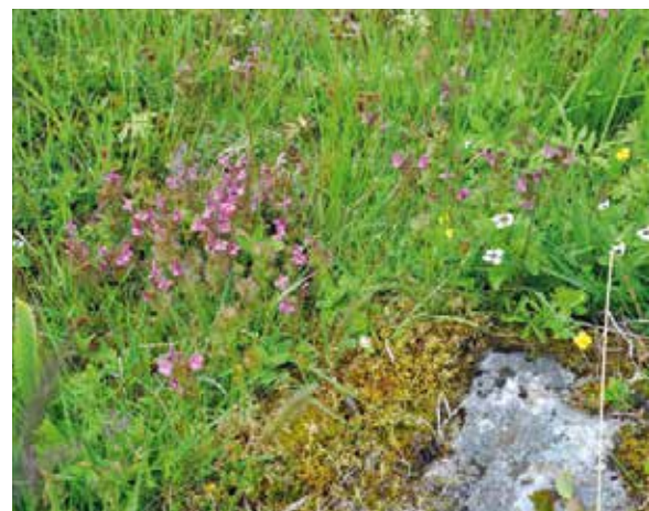
För varje år väcks fler hotade arter till liv på Linnés Råshult.