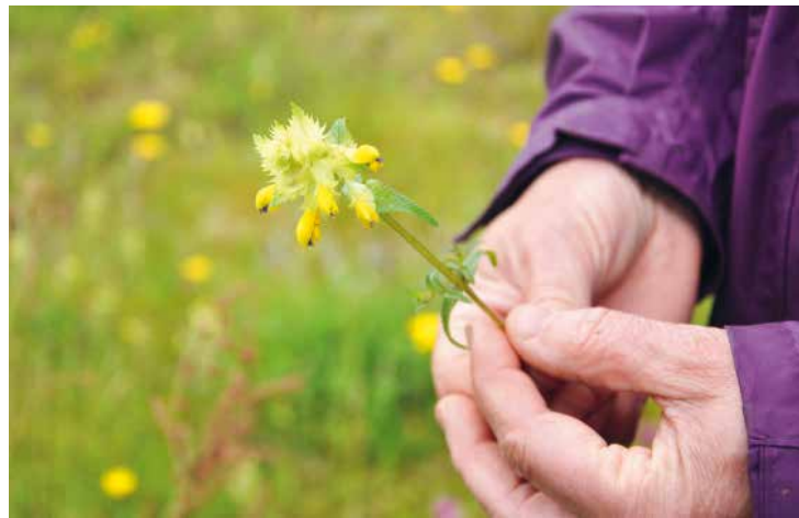
Höskallran finns med i Inger Runeson på Pratensis ängsfröblandningar. Enligt gammal bondetradition skallran den när ängen ska slå.

kanske har de lyckats återskapa den äng med ängsblommor som är lika älskvärda och konstlösa som på Linnés tid och som han lät sig förtrollas av under vår och sommar, då han inte hade tid att vara sjuk och dyster. ”Flora kommer strykande med hela sin sköna armé och jag måste mönstra henne”, skrev denne geniale 1700-talsintellektuelle, besatt inte bara av nytan av odling utan också dess skönhet.