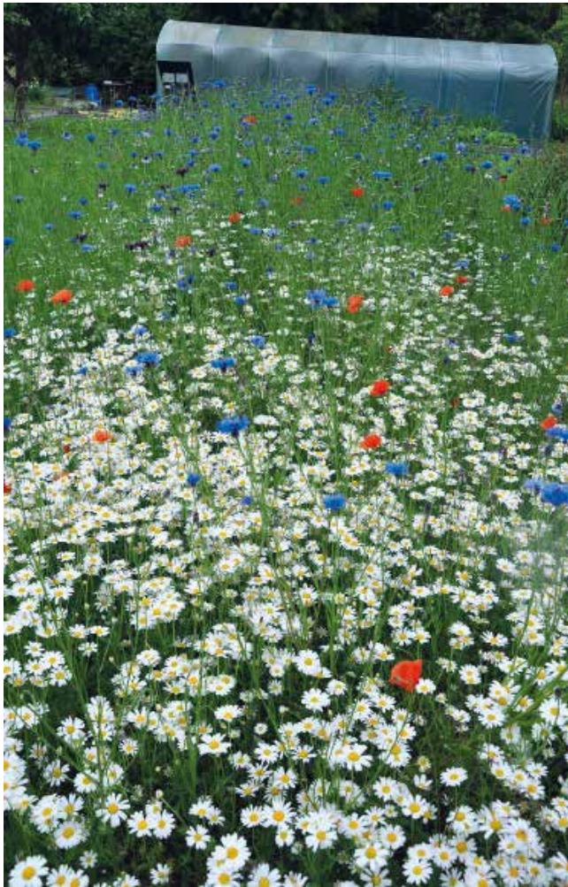
Många ängsblommor frösår sig, men t ex vallmo, klätt och blåklint är ettåriga och måste sås på öppen jord igen för att komma upp.