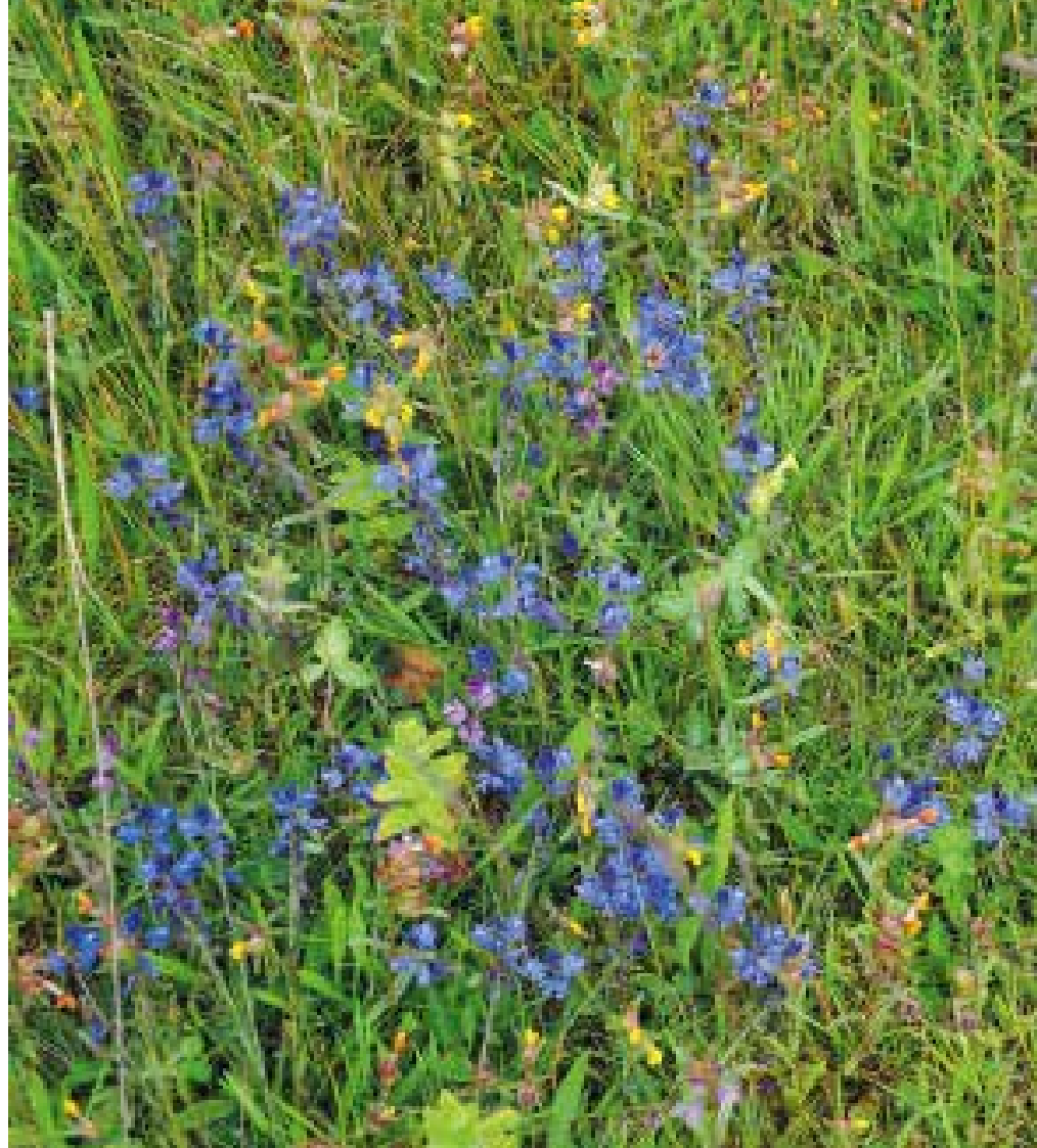
... blå jungfrulin.