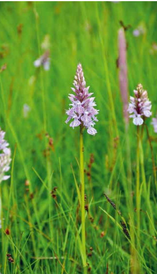
Här finns hela fält av svagrosa orkidéer som Jungfru Marie nycklar och ...