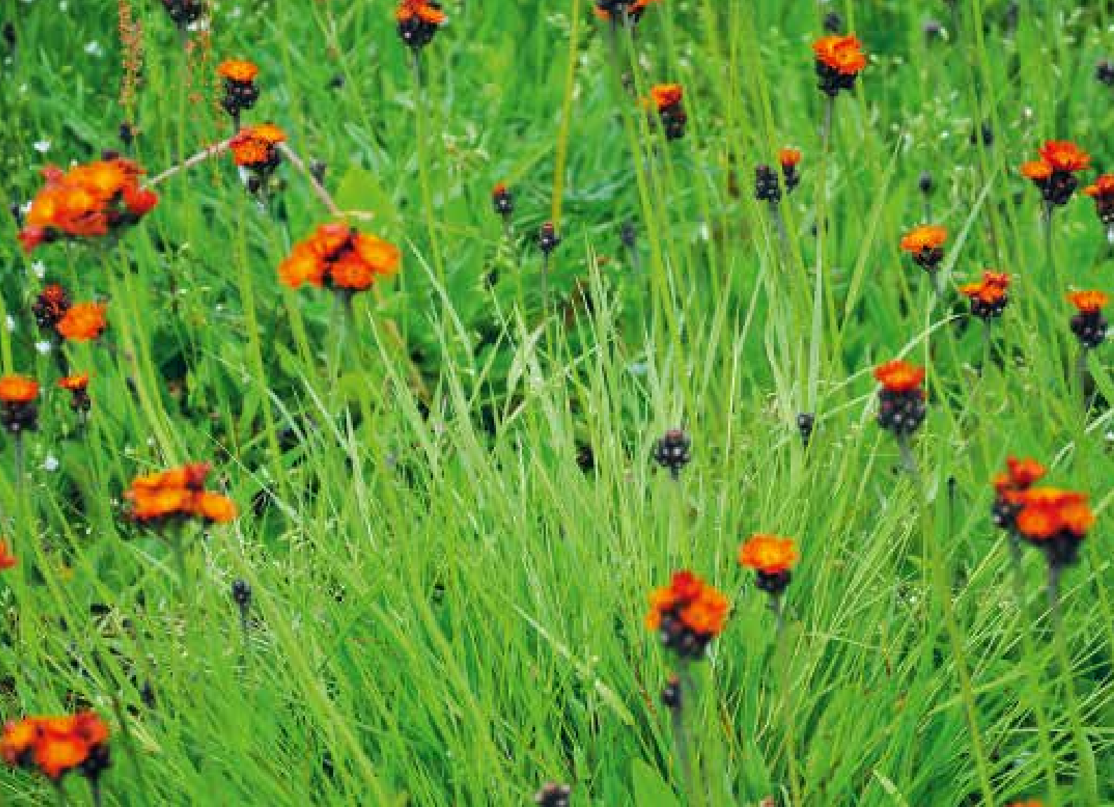
Rödfibblans glödande blommor lyser upp i blomsterängen på Opparyd Råsgård.