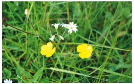
Mandelblom och smörblomma.

Ängar av U. Ekstam, M. Aronsson, N. Forshed, LT/Naturvårdsverket 1988.